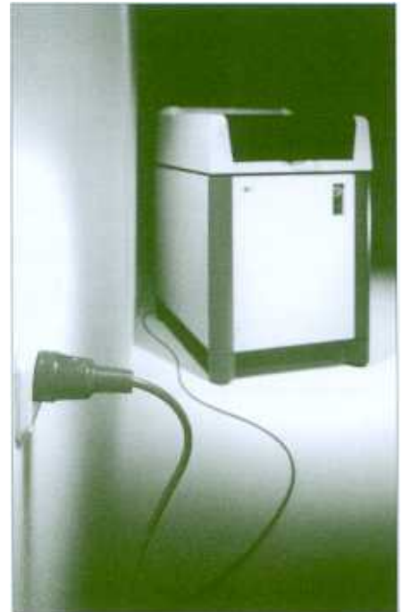
Figura 2: espectrómetro compacto de WD-FRX (S4 EXPLORER).

Un esfuerzo más ha sido mejorar la capacidad analítica y desarrollo de un sistema ED-FRX. La finalidad de conseguir un sistema con un manejo de muestras y funcionamiento más fácil, a través de una interfase de pantalla táctil, y más conveniente, basado en un instrumento para todo con nuevos métodos de evaluación para muestras de rutina y materiales desconocidos. La pantalla táctil representa la funcionalidad sin el uso de teclado y ratón para el personal sin experiencia en PCs, dando resultados desde el primer día. El diseño compacto de este tipo de instrumentos con ordenador e impresora integrados, pantalla táctil y vacío asegura el mínimo requerimiento de espacio y rápida instalación y colocación (Figura 3).