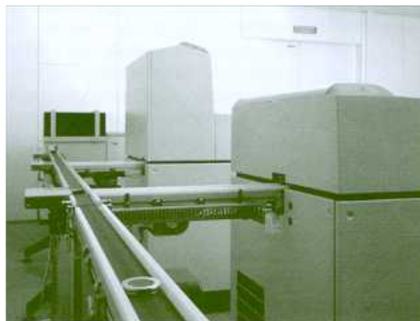
Figura 6: automatización de laboratorio con sistemas analíticos de rayos X.

temas automatizados son las claras ventajas de los modernos sistemas de análisis por rayos X para el análisis en el control de calidad y proceso. Los programas de Fluorescencia de Rayos X a la vez que fáciles de usar incluyen rutinas especializadas precalibradas y universales. La novedad más importante en la aplicación del análisis cuantitativo por Difracción de Rayos X es el último desarrollo del software especializado sin estándares por el método de Rietveld, permitiendo un análisis de fases completamente automatizado, incluso de muestras extremadamente complejas, en el tiempo más corto posible sin interacción del usuario. Los compactos sistemas de rayos X se ajustan tanto a las necesidades extremas de espacio para su instalación, como a las analíticas para el control de procesos y calidad.