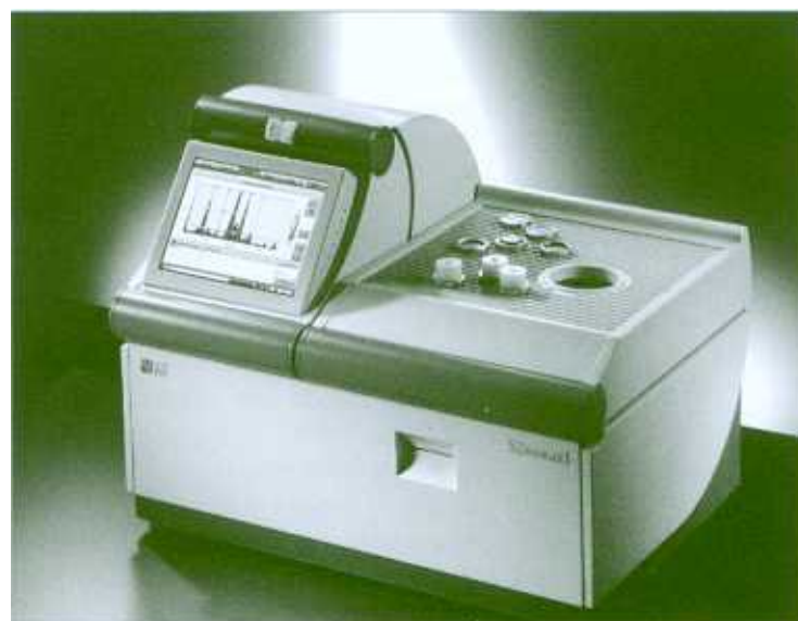
Figura 3: espectrómetro de mesa de ED-FRX con pantalla táctil (S2 RANGER).